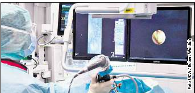
Laut Stern-Klinikliste erbringt das UKW in 29 Fachbereichen – zum Beispiel in der Urologie – herausragende Leistungen.

Hier die ausgezeichneten Fachbereiche des UKW: Adipositaschirurgie, Alzheimer, Angststörungen, Augenerkrankungen, Beckentumoren, Brustkrebs, Darmkrebs, Depression, Handchirurgie, Haut, Hautkrebs, Herzchirurgie, Hirntumoren, Interventionelle Kardiologie, Kinderchirurgie, Kreuzbandriss/Meniskus, Leukämie, Multiple Sklerose, Parkinson, Prostatakrebs, Psychosomatik, Risikogeburten, Schilddrüsenchirurgie, Schlaganfall, Strahlentherapie, Unfallchirurgie, Urologie sowie Zahnmedizin (zwei Mal).