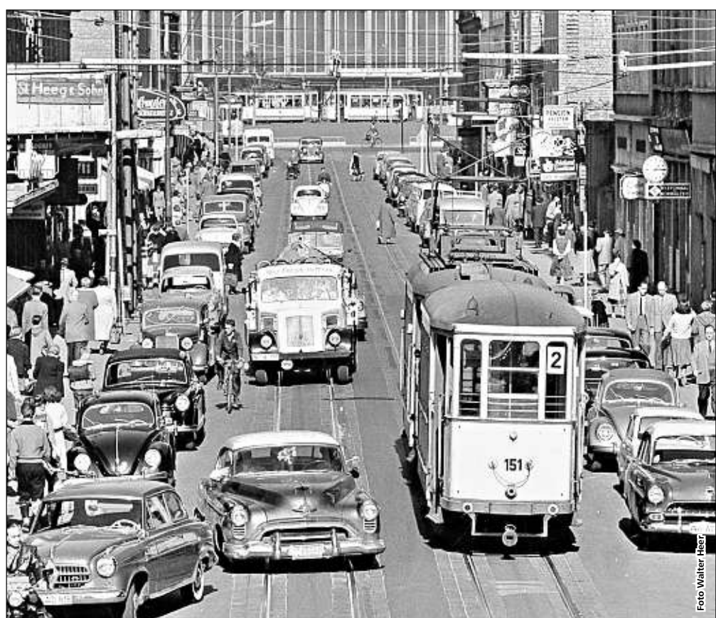
Die Kaiserstraße in den 50er Jahren.

Weier: Zwar ist es richtig, dass der Anteil des Onlinehandels am gesamten Einzelhandelsumsatz von ca. 11,5 Prozent vor der Pandemie auf inzwischen 14,5 Prozent gestiegen ist und sich diese Entwicklung weiterhin fortsetzen wird. Die Steigerungskurve des Onlinehandels verläuft allerdings inzwischen etwas flacher, und es gibt Anzeichen, dass sich die Leute durchaus auf die Stärken des stationären Einzelhandels – Haptik, Beratung, Service, Einkaufserlebnis usw. – besinnen. Hier muss der Handel weiterhin an sich arbeiten und genau diese Stärken in den Vordergrund stellen. Zudem ist es für Händler unerlässlich, digital sichtbar zu sein und online gefunden zu werden. Fitte Unternehmer haben die Zeit während der Lockdowns genutzt, Omnichannel-Strategien entwickelt und sich digital neu aufgestellt. Für alle, die ihre digitalen Hausaufgaben immer noch nicht erledigt haben, gilt – leider: „Wer nicht mit der Zeit geht, geht mit der Zeit!“ Diesen Prozess erleben wir gerade – bei großen wie auch kleinen Unternehmen, häufig unvermittelt und meist schneller als erwartet. Denn der nächste Trend – „Unified Commerce“, in dem alle Stufen der Customer Journey nahtlos miteinander vernetzt werden – klopft K.I.-unterstützt schon an die Tür.