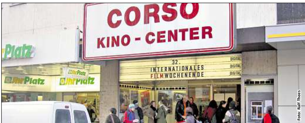
Das Corso sorgte für Leben in der Straße.

nicht möglich. Man wird also immer auf Pflanzkübel oder ähnliches angewiesen sein. Die Palmen wurden meines Wissens gewährt, weil sie relativ pflegeleicht sind, erwiesen sich jedoch als kümmerlich