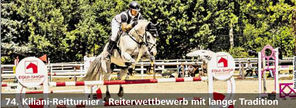
74. Kiliani-Reitturnier - Reiterwettbewerb mit langer Tradition

Von Freitag, 14. Juli bis Sonntag, 16. Juli 2023 steht auf dem wunderschönen Gelände des Reit- und Fahrvereins Würzburg und Umgebung e.V. in der Mergentheimer Straße wieder alles im Zeichen des Kiliani-Reitturniers. Bereits seit 1949 findet der Traditionswettbewerb immer parallel zum Würzburger Kiliani-Fest statt. In 15 Prüfungen können sowohl Nachwuchsreiter, zum Beispiel bei den Stilsprungprüfungen der Klasse A, wie auch Fortgeschrittene beim sportlichen Höhepunkt des Turniers, dem S-Springen, ihr Talent unter Beweis stellen.