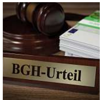
Starkes Urteil für Versicherte.

Bei einem Widerruf erhalten Sie – anders als bei der Kündigung – alle eingezahlten Beiträge ohne Abzug von Maklerprovisionen und Verwaltungskosten zurück. Und nicht nur das: Die Versicherung muss Sie auch an dem mit Ihrem Geld erzielten Anlageertrag beteiligen. So können Sie bis zu 150 % der eingezahlten Beiträge zurückholen. Ein sattes Plus auf Ihrem Konto winkt!